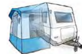
Exempel på campingfordon.